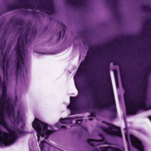
Joh. S. Svendsen